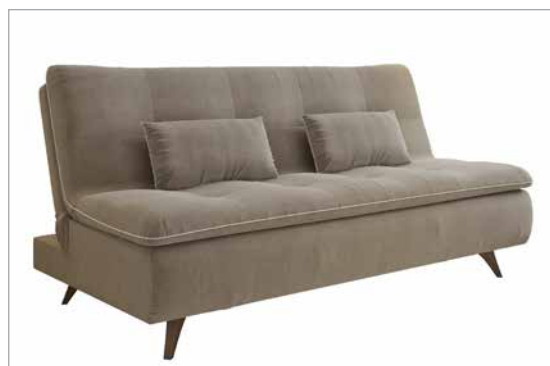
Sofá cama | Sofa bed