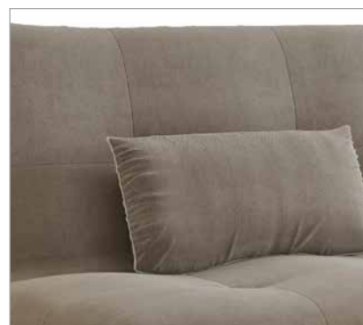
Encosto e almofada | Backrest and cushion