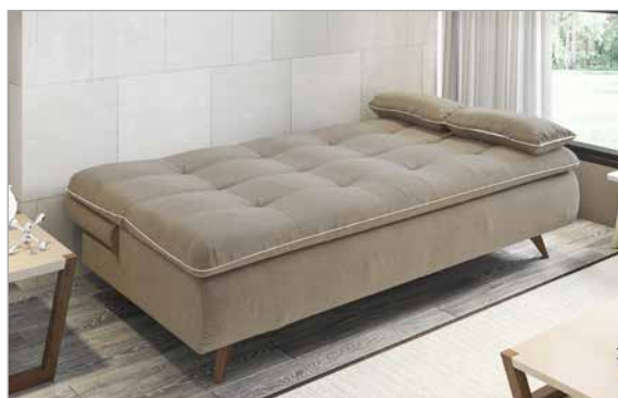
Sofá cama aberto | Open sofa bed