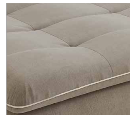
Assento | Seat